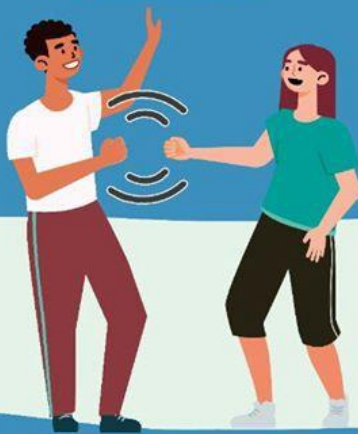
CON EL PUÑO DE LEJOS