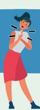
JUNTANDO LAS MANOS