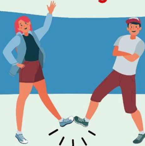
CON EL PIE