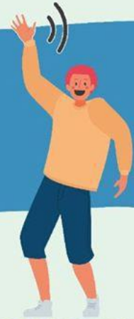
AGITANDO LAS MANOS