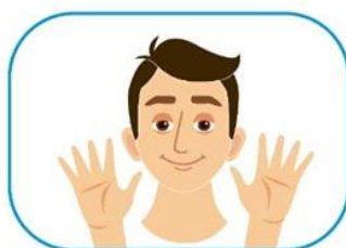
2 No se toque la cara si no se ha lavado las manos