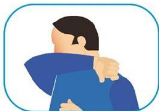
4 Protocolo de estornudo y tos