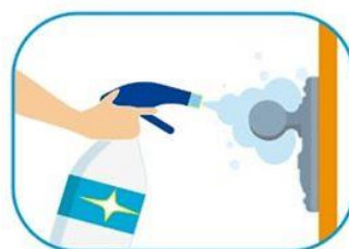
3 Limpiar las superficies de alto contacto