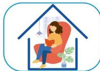
6 Quedate en casa