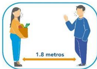
5 Distanciamiento social