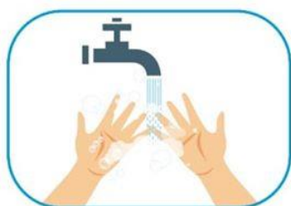
1 Lavado de manos