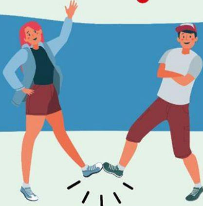
CON EL PIE