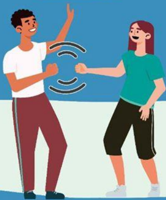
CON EL PUÑO DE LEJOS